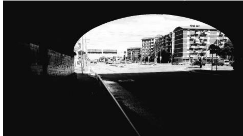
foto attuale del tunnel e Viale Forlanini