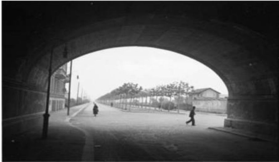
foto storica del tunnel e Viale Forlanini