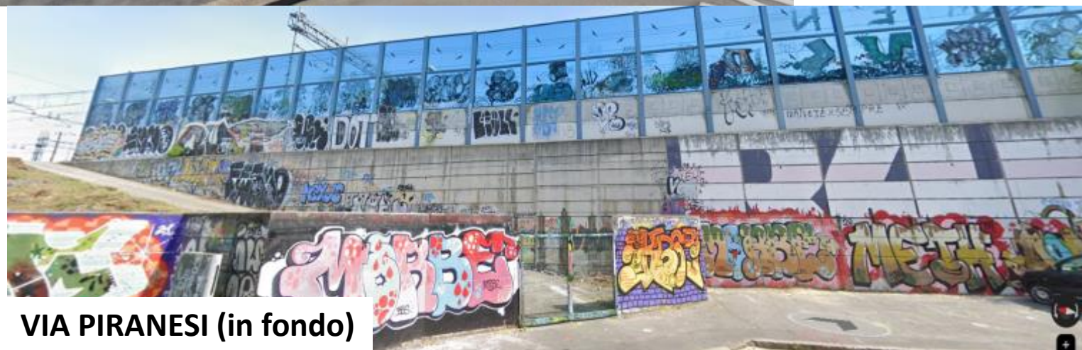
VIA PIRANESI (in fondo)