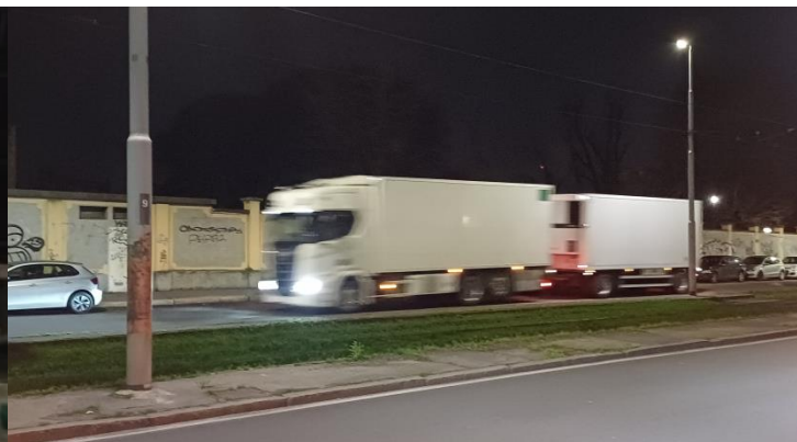
Via Marco Bruto